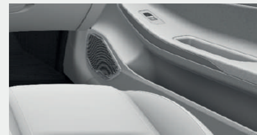
GRIS CON AZUL* 1.5T Unlimited

*Interior gris/azul limitado a ciertas unidades, consúltalo con tu concesionario OMODA más cercano.